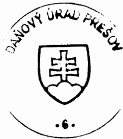
Ing. Ludmila Fedorová vedúci oddelenia správy daní 2

Toto oznámenie sa vyvesuje po dobu 15 dní. Podľa § 35 ods. 2 zákona č. 563/2009 Z. z. v znení neskorších predpisov posledný deň tejto lehoty sa považuje za deň doručenia.