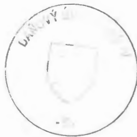
Ing. Ludmila Fedorová vedúci oddelenia správy daní 2

Toto oznámenie sa vyvesuje po dobu 15 dní. Podľa § 35 ods. 2 zákona č. 563/2009 Z. z. v znení neskorších predpisov posledný deň tejto lehoty sa považuje za deň doručenia.