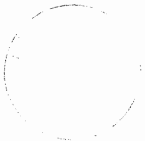
Ing. Ludmila Fedorová vedúci oddelenia správy daní 2

Toto oznámenie sa vyvesuje po dobu 15 dní. Podľa § 35 ods. 2 zákona č. 563/2009 Z. z. v znení neskorších predpisov posledný deň tejto lehoty sa považuje za deň doručenia.