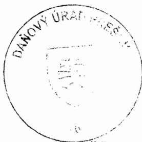
Ing. Ludmila Fedorová vedúci oddelenia správy daní 2

Toto oznámenie sa vyvesuje po dobu 15 dní. Podľa § 35 ods. 2 zákona č. 563/2009 Z. z. v znení neskorších predpisov posledný deň tejto lehoty sa považuje za deň doručenia.