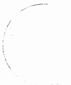
Ing. Ludmila Fedorová vedúci oddelenia správy daní 2

Toto oznámenie sa vyvesuje po dobu 15 dní. Podľa § 35 ods. 2 zákona č. 563/2009 Z. z. v znení neskorších predpisov posledný deň tejto lehoty sa považuje za deň doručenia.