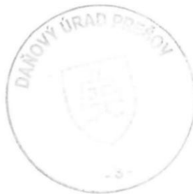
Mgr. Jana Poklembová poverená zastupovaním vedúceho oddelenia daňovej exekúcie 1

Toto oznámenie sa vyvesuje po dobu 15 dní. Podľa § 35 ods. 2 zákona č. 563/2009 Z. z. v znení neskorších predpisov posledný deň tejto lehoty sa považuje za deň doručenia.