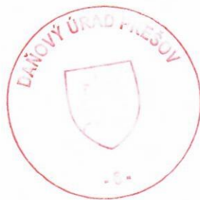
Ing. Ludmila Fedorová vedúci oddelenia správy daní 2

Toto oznámenie sa vyvesuje po dobu 15 dní. Podľa § 35 ods. 2 zákona č. 563/2009 Z. z. v znení neskorších predpisov posledný deň tejto lehoty sa považuje za deň doručenia.