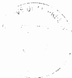
Ing. Ludmila Fedorová vedúci oddelenia správy daní 2

Toto oznámenie sa vyvesuje po dobu 15 dní. Podľa § 35 ods. 2 zákona č. 563/2009 Z. z. v znení neskorších predpisov posledný deň tejto lehoty sa považuje za deň doručenia.